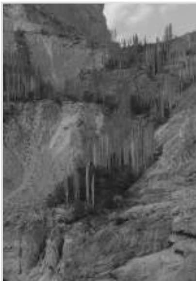
بلين تري سونامي

جنهن کي حڪومت طرفان اقدرتي رهاڻش گاهه ۾ نباتات، جانورن جي تحفظ لاءِ مخصوص ڪيو آهي. اها تحقيق، تعليم ۽ تفريح لاءِ عوام تائين رسائي آهي. عوامي استعمال کي هٿي وٺرائڻ لاءِ روڊن ۽ ريسٽ هائوسن جي تعمير جي اجازت ڏني وئي آهي. انهن علائقن ۾ هٿيارن جي استعمال، جهنگلي جيوت جي آلودگي تي پابندي لڳل آهي. سڀ کان پراڻو پارڪ بهاولپور ۾ لال سوهانه آهي، جيڪو 1972ع ۾ تعمير ڪيو ويو.