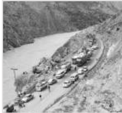
جبل جي چوٽيءَ تان ورتل ھڪ صویر

چيو ته ان جي منع ٿيل آهي. اتي اسان تازن اخروتن ۽ پيسر جي جوس جو مزو ورتو، جيڪو ڪنهن ڪيميڪل کان سواءِ سڌو سنئون ڪچو ميوو مان ٺاهيو ويو هو.