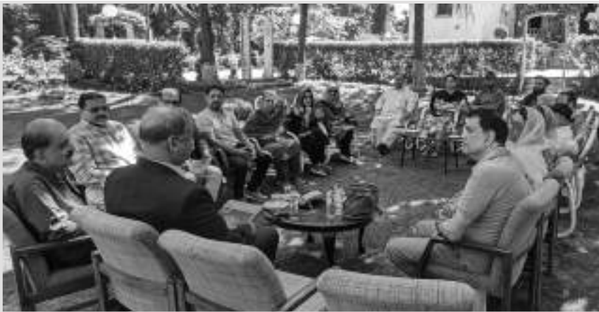
چيف سيڪريٽري گلگت بلتستان سان ملاقات

جنهن ۾ جبل جي چوٽيءَ سان گڏوگڏ وهندڙ هڪ درياھ آهي. ريسٽورنٽ تي ۽ ان جبل جي وچ ۾ اسان کي ”ياڪ برگر“ ريسٽورنٽ ڏانهن ويندڙ گاڏين جي هڪ