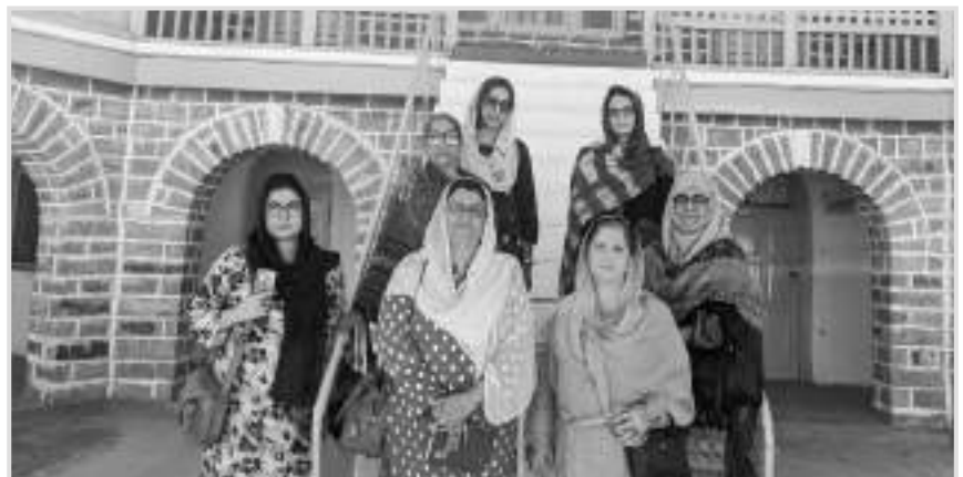
غلڪين وادي ۾ نماز وارو علائقو ۽ ڪميونٽي سينٽر

اتان جي ٽن (03) ڳوٺن ۾ خواندگي جي شرح 100 سيڪٽو هئي، 1300 فردن مان 14 ماڻهو پرڏيهه ۾ پڙهي رهيا هئا، اسڪول اچڻ لاءِ چوڪرين کي ان حد تائين پهچڻ لاءِ گليشيشر پار ڪرڻو پوندو آهي. هتي آءِ يو سي اين هڪ پرائي گهر جي