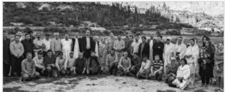
غلڪن وادي جي ميمبرن سان گڏ فوتوگرافي

جيسيتائين ائين ٿي چڪو هو، اسان محسوس ڪيو ته هاڻي گهڻي دير ٿي چڪي هئي، ڇاڪاڻ ته واپسي واري سفر ۾ گهٽ ۾ گهٽ ڏيڍ ڪلاڪ لڳندو ۽ اسان کي ٻئي ڏينهن اسڪرڊو کان واپسي لاءِ فلاڻيٽ وٺڻي هئي. سومون پنهنجي ڏيءَ سان گڏجي چيما صاحب سان گڏ هوٽل