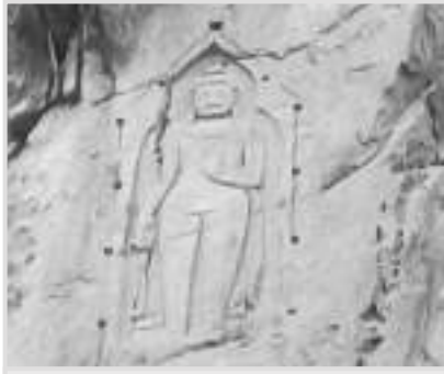
قديم ٻڌ (ياشاني)

کمیونٹی جو دورو کرڻ کان پوءِ اسان قديم مهاتما ٻڌ (مقامي طور تي ياشاني جي نالي سان مشهور) ڏسڻ لاءِ ويا. اسان کي درياھ جي ڪناري کان نقش نگاري جو سٺو نظارو وڻيو ان رات آءِ يوسي اين هڪ ڏنر