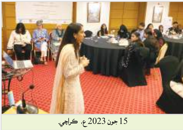
15 جون 2023 ع، ڪراچي

اڄ جي پيچيده دنيا ۾ نوجوان هڪ ڏکئي مسئلي کي منهن ڏئي رهيا آهن: ماحولياتي بحران، وڌندڙ عدم مساوات، ۽ هڪ غير محفوظ مستقبل. انهن محدود چئلينجن جي وچ ۾ موقعن جي کوٽ ۽ غير ذميواري جهڙا عنصر گهڻو ڪري نوجوانن کي بي آواز محسوس ٿين ٿا. ڪيترن ئي ملڪن ۾ اڌ کان وڌيڪ آبادي تي مشتمل هجڻ جي باوجود، نوجوان ماڻهو (18 کان 30) اڪثر ڪري مرڪزي ڌارا جي سياست ۽ فيصلي سازيءَ کان پوئتي رهجي ويا آهن. پاڪستان ان جو هڪ مثال آهي. 30 سالن کان گهٽ عمر وارا 64 سيڪٽر، 15-29 جي وچ ۾ 29 سيڪٽر جي صلاحيت غير استعمال آهي. انهن لاءِ تعلق بڻيل نوجوان ووترو جو ترن اٿوٽ نهايت ئي گهٽ آهي. پاڪستان جي گذريل اٺن چوٿين ۾، نوجوانن جو ترن اٿوٽ سراسري طور 31 سيڪٽر رهيو، جڏهن ته 2018 ع ۾ مجموعي طور تي 44 سيڪٽر جي مقابلي ۾ 13 پوائنٽن جو فرق آهي. هڪ شاندار 18 ملين رجسٽرڊ نوجوان ووترو پاران ووت ئي نه ڏنو ويو. پوءِ به اميد، انهن جي لاتعداد صلاحيتن ۾ موجود آهي. ڍان نيسوز جي رپورٽ مطابق 35 سالن کان گهٽ عمر