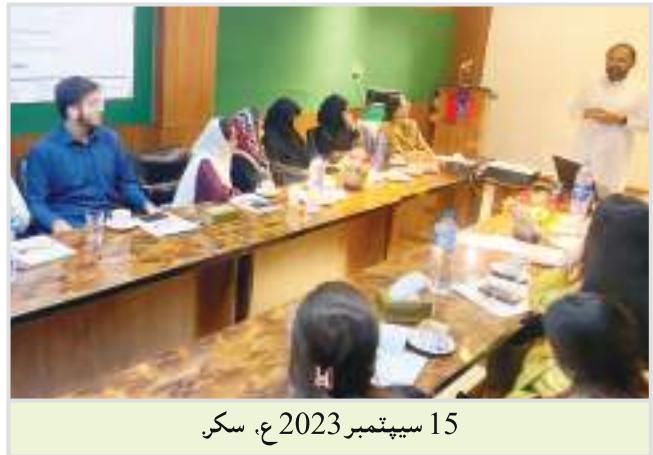
15 سيپٽمبر 2023 ع، سکر