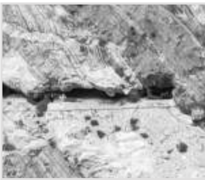
گليشيشر وارو پاسو

جنهن ۾ جبل جي چوٽيءَ سان گڏوگڏ وهندڙ هڪ درياھ آهي. ريسٽورنٽ تي ۽ ان جبل جي وچ ۾ اسان کي ”ياڪ برگر“ ريسٽورنٽ ڏانهن ويندڙ گاڏين جي هڪ