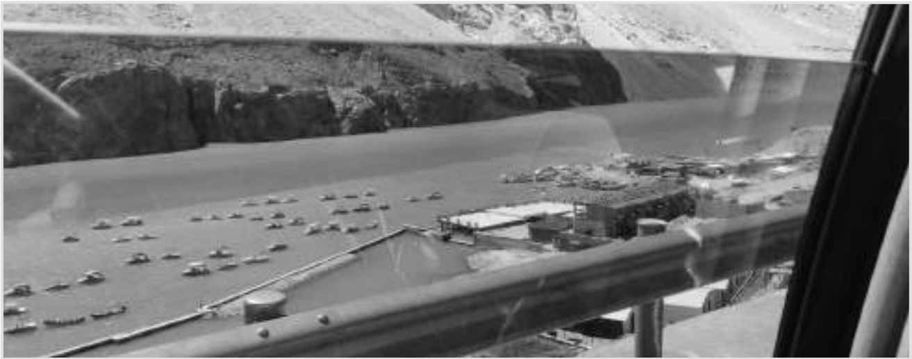
عطا آباد ڍنڍ - توهان پاڻي جي رنگن ۾ واضح فرق سان انساني سرگرمين جي تباهي کي ڏسي سگهو ٿا.